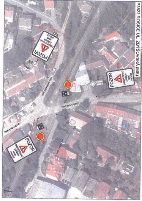
P3822 ROSICE UL. ZBÝŠOVSKÁ (11394)