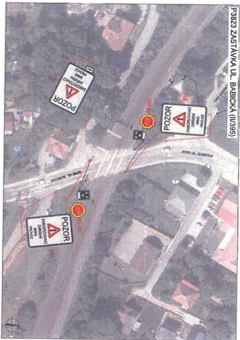
P3823 ZASTÁVKA UL. BABICKÁ (11395)