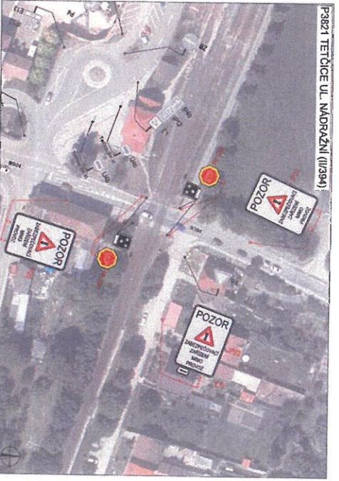
P3821 TETČOVICE UL. NA DRAŽNÍ (11394)